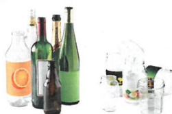
BOUTEILLES, POTS ET BOCAUX EN VERRE