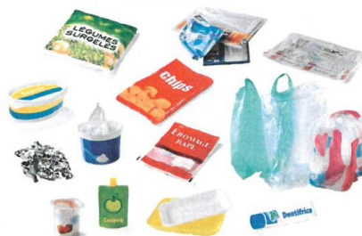
TOUS LES AUTRES EMBALLAGES