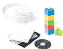
OBJETS EN PLASTIQUE (QUI NE SONT PAS DES EMBALLAGES)