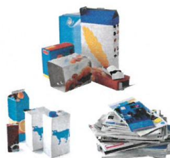
PAPIERS, EMBALLAGES EN CARTON ET BRIQUES ALIMENTAIRES