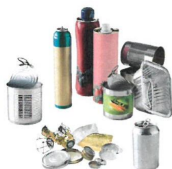
EMBALLAGES EN MÉTAL MÊME LES PETITS