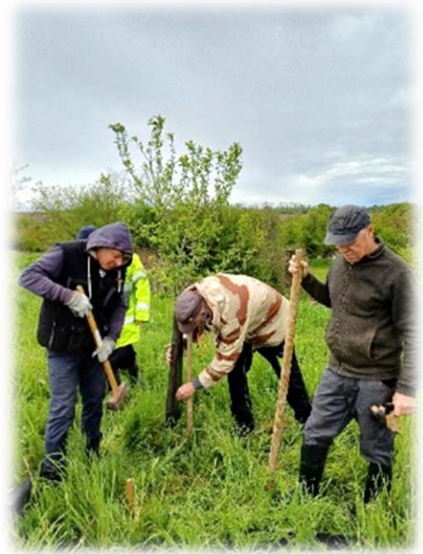
Quelques activités de l'année : redresser des arbres et les protéger contre les chevreuils.